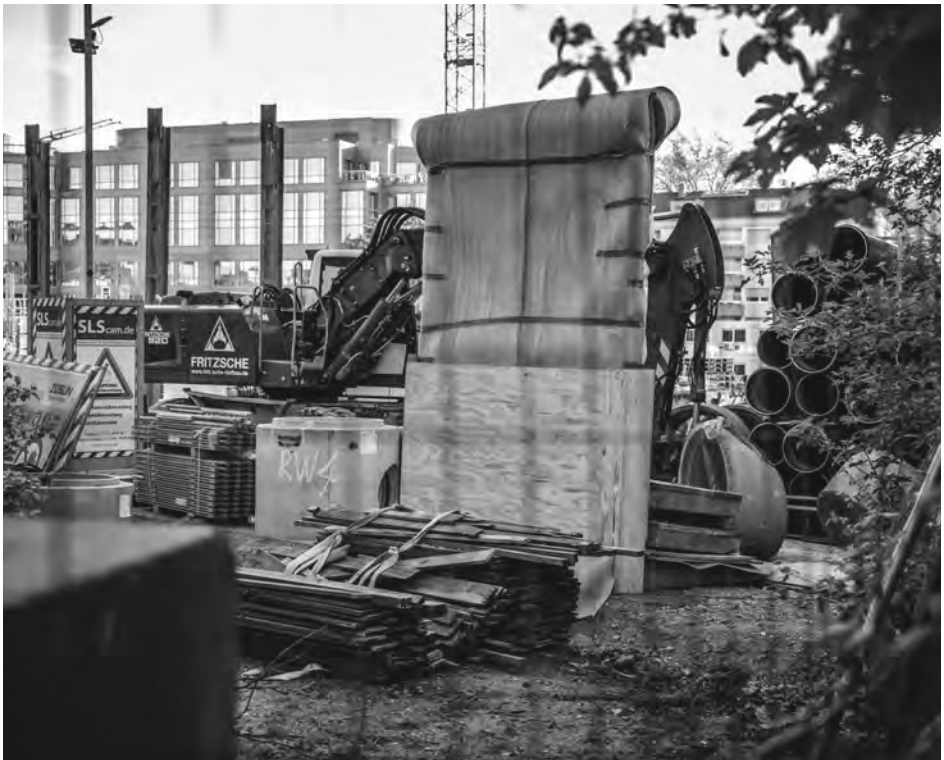
Gut verpackt erlebt das Stück Berliner Mauer die Bauarbeiten rund um den Kennedydamm in Golzheim.

daraus wird, will sie noch nicht sagen. Eines Tages wird das Mauer-Teil also womöglich wieder gebraucht, ein bisschen Hoffnung bleibt. Das ist bei der Mauer ja schon einmal gut gegangen. Es ist Anfang Mai, als ich wieder bei der Mauer vorbeischaue. Meine Augen brauchen diesmal einen Moment, bis ich sie auf der Baustelle ausmachen kann. Inzwischen ist der Beton vollständig verhüllt – unten herum mit Holz und oben mit Schaumstofffolie, die etwas durchsichtig ist. Die Augen dahinter sind immer noch weit aufgerissen.