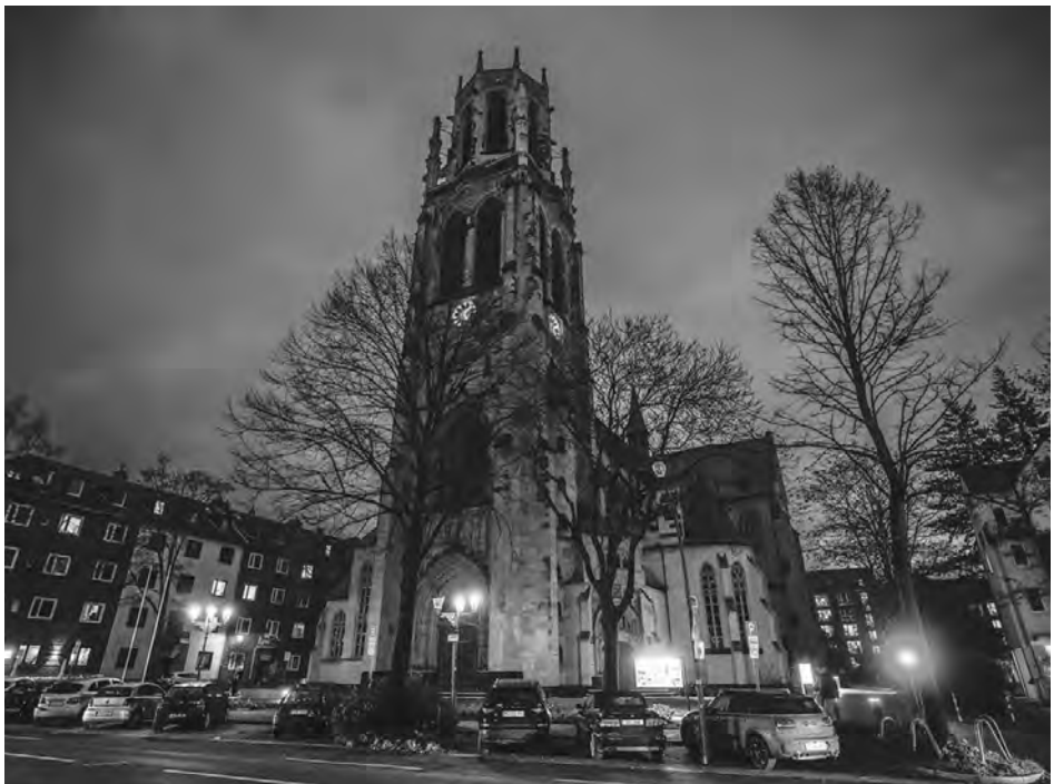
Die Herz-Jesu-Kirche bleibt dunkel.

Von 2007 bis 2010 waren acht Halogen-Scheinwerfer mit insgesamt 2800 Watt