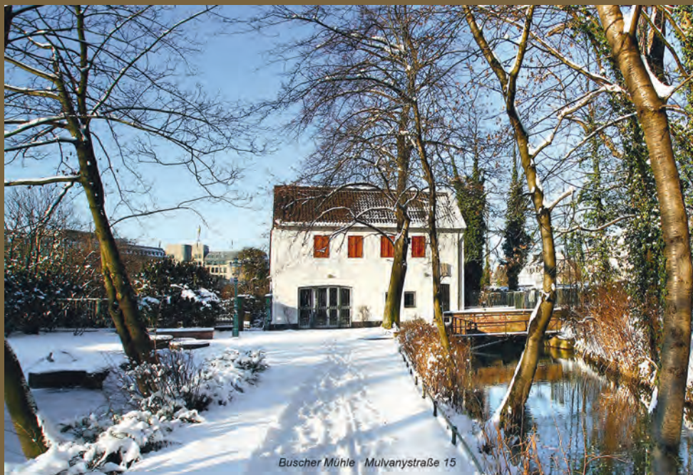
Buscher Mühle Mulvanystraße 15

Monatszeitschrift der derendorfer jonges