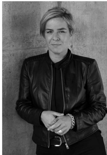
Bündnis 90/die Grünen - Mona Neubaur