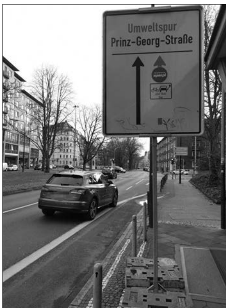
Die Umweltspur an der Prinz-Georg-Straße soll am 1. März abgeschafft werden.

Was die Abschaffung der Umweltspuren verkehrstechnisch für Pempelfort bedeutet ist noch unklar. Denn für Autofahrer ändert sich wohl erst einmal nichts. Die beiden Umweltspuren auf der Prinz-Georg-Straße sollen nach Vorschlag der Stadtverwaltung in Radfahrstreifen umgewandelt und dann für Linienbusse freigegeben werden. Elektroautos oder Taxis dürfen die Spuren dann nicht mehr nutzen. So soll der Radverkehr in der Stadt gestärkt werden.