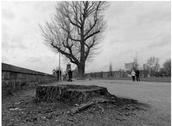
1356 Bäume werden im Stadtgebiet gefällt.

Der Baumbestand zeigt deutliche Spuren durch die extreme Trockenheit in den Jahren 2018, 2019 und 2020. Im Gesamtboden herrscht außergewöhnliche Dürre, im Oberboden in Teilen schwere Dürre, erklärt die Stadt. Dies hat zur Folge, dass insbesondere Bäume in ihrer Vitalität sehr stark beeinträchtigt sind und vermehrt absterben. Durch