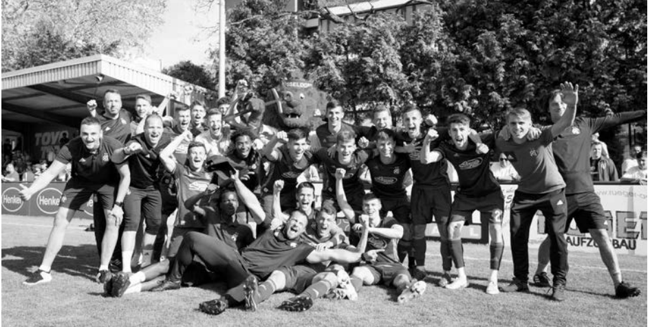
Dinamo Zagreb geht als Titelverteidiger an den Start.

Fortuna gegen Everton, BV 04 gegen Sporting Braga, oder Borussia Mönchengladbach gegen Dinamo Zagreb! Die 58. Ausgabe der CRB U19 Champions Trophy beim BV 04 verspricht spannende Spiele und hochklassigen Fußball. Das Düsseldorfer Prinzenpaar hat im Februar die Gruppen für die 58. Auflage des Osterturniers beim BV 04 vom 9. bis zum 13. April ausgelost.