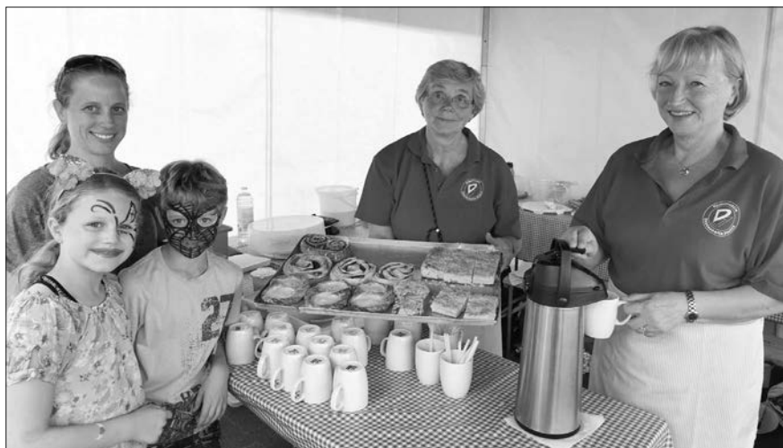
Auch die Kinder hatten Spaß. Kuchen servierten die Frauen der Jonges.

Zeit für Gespräche über das Leben im Viertel. Dank des ehrenamtlichen Einsatzes des Heimatvereins war das Nachbarschaftsfest ein voller Erfolg und ein wenig Geld, mit dem der Erhalt der Buscher Mühle finanziert wird, blieb auch in der Vereinskasse. Bereits 1992 haben die Derendorfer Jonges das erste Buscher-Mühlenfest veranstaltet. Damals war der Anlass die Wiedereröffnung nach den großen Renovierungsarbeiten.