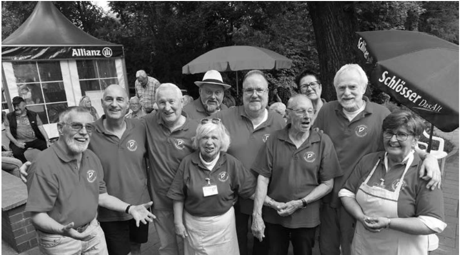
Die Derendorfer Jonges hatten jede Menge Spaß beim Helfen und beim Feiern.

Musik, Bierchen, Grillwurst und strahlender Sonnenschein: Das waren die Zutaten, die das Buscher-Mühlenfest des Heimatvereins Derendorfer Jonges am Samstag, dem 24. August, zum ebenso bunten wie erfolgreichen Nachbarschaftsfest haben werden lassen. Rund um die Buscher Mühle hatten