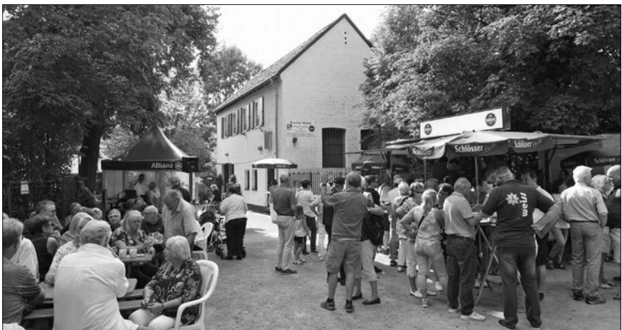
Strahlender Sonnenschein und ein gutes Programm sorgten für ein volles Haus.

Für Kinder kam das Spielmobil aus Flingern, für die Erwachsenen sorgten die Band „The Candidates“ und DJ Werner für Musik und Stimmung. Zwischendurch blieb jede Menge