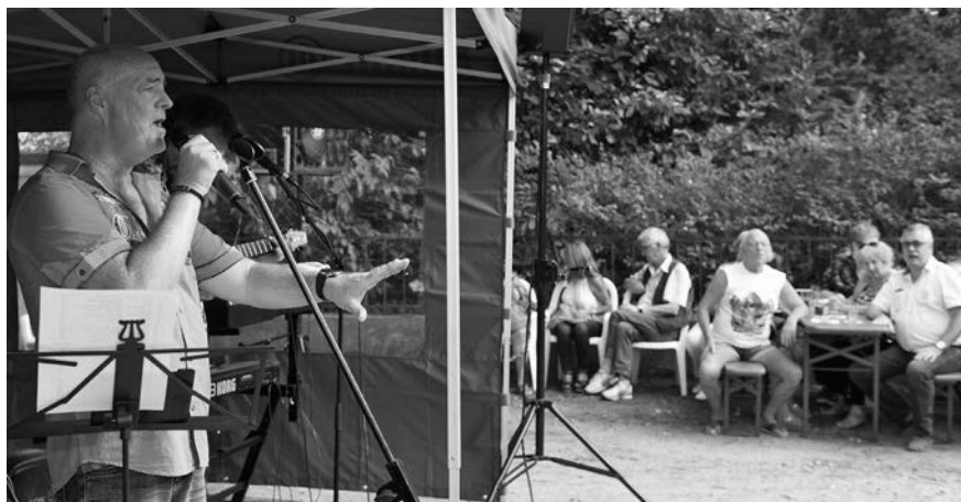
Die Band „The Candidates“ sorgte mit Rockmusik für Stimmung.