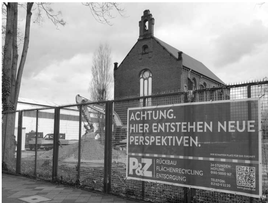
Auch im nördlichen Bereich tut sich etwas

schon sehr frühzeitig eine Initiative gegründet, die sich für bezahlbare, barrierefreie Mietwohnungen einsetzt. Diese Bürgerplattform: „WIG – Wohnen in Gemeinschaft – Leben auf der Ulmer Höh“ wünschte sich ein Wohnprojekt für gemeinsames, selbstverantwortliches Wohnen mit Gemeinschaftsräumen und Außenanlagen. In intensiven Gesprächen mit dem Investor, der Stadt und Bauämtern hoffte man, auf einem erfolgreichen Weg zu sein. Aber der jetzige Stand ist leider ein ganz anderer. Gebaut werden zuerst nur die Eigentumswohnungen in einer Preisklasse um die 6.500 Euro/m 2 . Da kommt die „WIG“ nicht zum Zuge. Später will der Investor auch zwei Häuser mit Mietwohnungen auf dem