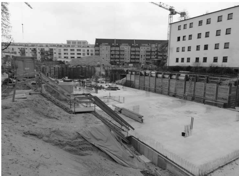
Das Tal für die Fundamentierung des ersten Gebäudes

Jedoch kam der Verkauf des nördlichen Areals, das im Besitz des BLB ist, nicht