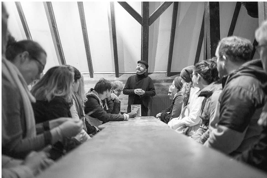
Die Gruppe TheaterKunstKöln ist schon im vergangenen Jahr in der Buscher Mühle aufgetreten

An drei Abenden im Mai und vier Terminen im Juli des vergangenen Jahres war die Buscher Mühle Spielort des Stationen-Theaterstücks „Das Karussell der Erinnerungen“. Im April kehrt die Theatergruppe des Vereins TheaterKunstKoeln e.V. zurück und führt das Stück erneut am 10. und 11. April auf.