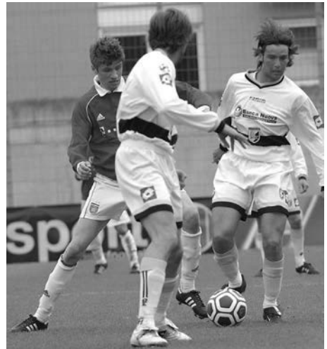
Thomas Müller hat 2006 in Düsseldorf mitgespielt.

Stephen Gerrard oder in den 80er Jahren der