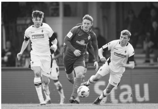
Joshua Sargent (Mitte) spielte 2018 mit Werder Bremen mit und sorgt inzwischen in der Bundesliga für Furore.

spätere WM-Torschützenkönig Oleg Salenko. Gespielt wird auf dem Rasenplatz beim BV 04 in Düsseldorf, einem kleinen Schmuckkästchen, das mitten im Wohngebiet an