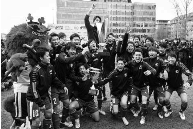
Die Japanische Hochschulauswahl hat das Turnier 2018 gewonnen.

eines der bestbesetzten Osterturniere in Europa. Viele andere Turniere haben in den vergangenen Jahren aufgeben müssen, weil auch viele Jugendmannschaften das Osterwochenende frei nehmen wollen, um die Belastung aus Bundesliga und Youth-League, der U19 Champions League, zu minimieren.