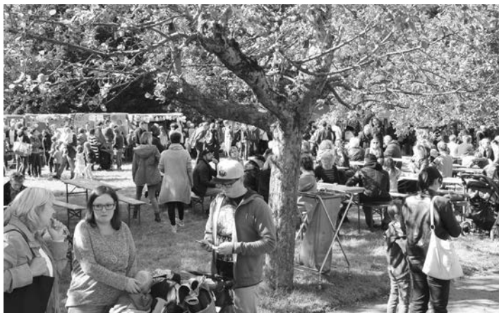
Volle Wiese beim Fest