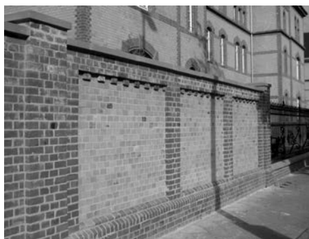
Einfassung der ehemaligen Kaserne entlang der Ulmenstraße

Nun erstrahlt sie seit einem Monat in neuem, schönem Glanz. Die originalen zweifarbigen Ziegelsteine wurden gereinigt und von Fachleuten denkmalgerecht aufgearbeitet. Die Umrandungen und Stützpfiler sind in roten Steinen und die dazwischen liegenden Felder mit gelben Steinen gemauert. Den Abschluss bilden neue Dachsteine aus hellem rötlichem Sandstein. Ebenso wurde ein Teil des historischen Gitterzauns saniert.