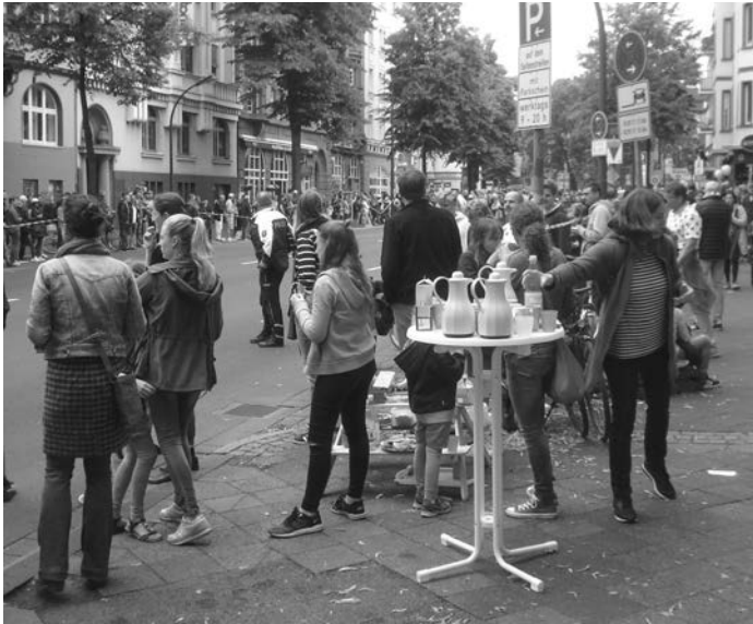
Picknick und gute Laune auf der Roßstraße, ...