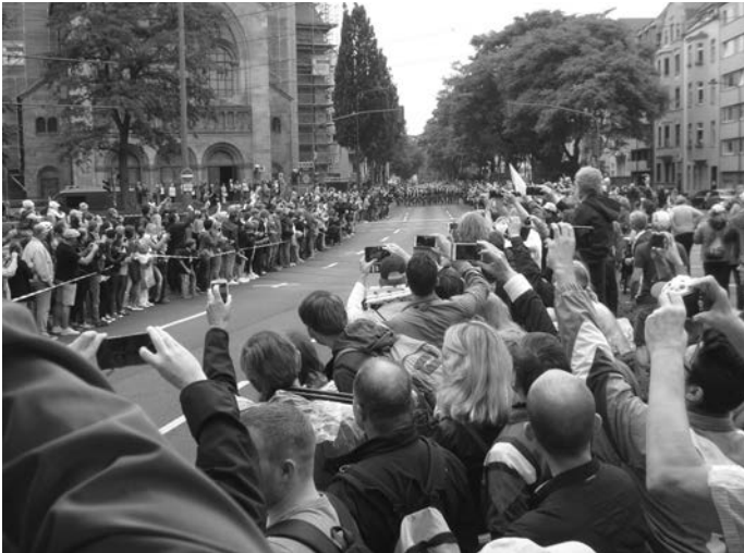
An der Kreuzkirche – Das Fahrerfeld kommt

Für den normalen Radfahrer wäre es eine Tagestour. Mal so eben über Neandertal, Mettmann, Ratingen und zurück. Nicht so für die Jungs in den engen Trikots. Es dauert nur etwa eine Stunde, dann war der Radsportzirkus wieder da. Die Werbekarawane, Motorräder, Polizei, Begleitfahrzeuge und da kommen sie .... und wusch, sind auch schon wieder vorbei. Allerdings hatte sich nun das Fahrerfeld schon etwas in die Länge gezogen, sodass man doch mehr sehen konnte.