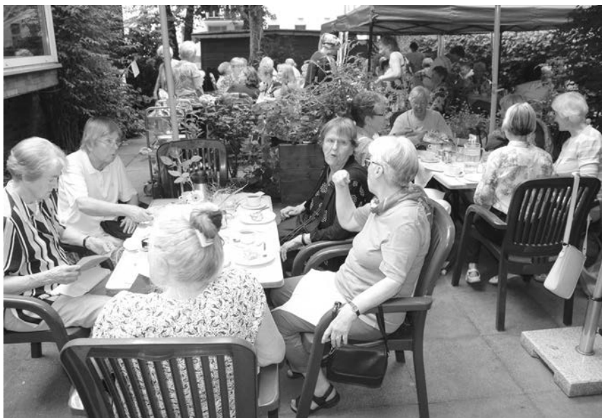
Kaffeeklatsch im Garten bei sommerlicher Hitze

Die erfolgreiche Kooperation mit der evangelischen Kirchengemeinde und die Zusammenarbeit mit der Bezirksvertretung 1 wird auch in Zukunft fortgesetzt, damit noch viele solcher Feste stattfinden können.