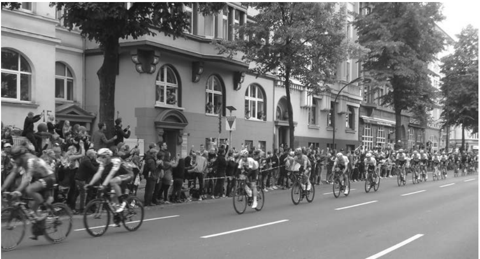
... kurz danach saust das Feld vorbei.