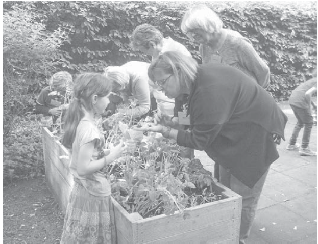
Auf Tiersuche im Hochbeet

Zum Abschluss versammelten sich alle Teilnehmer wieder im Innenraum. Es gab einen Imbiss und Getränke. Den selbstgepflanzten Salat konnte man heute noch nicht verarbeiten. Vor den Sommerferien soll das Gartenprojekt mit der Ernte vorerst abgeschlossen werden. Es folgt der gemeinsame Verzehr der Produkte aus den eigenen Hochbeeten – sprich aus dem Innenhof vom Zentrum Plus. Sicherlich wird es ein leckerer Salat werden. Danach, auch in Zukunft, können die Beete gerne weiterhin beackert werden. Einen Dank und große Anerkennung an