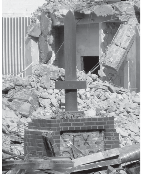
Einsames Schwert in der Trümmerwüste

Bleibt noch die Frage, was mit dem Denkmal geschieht. Mitten im Schutthaufen steht