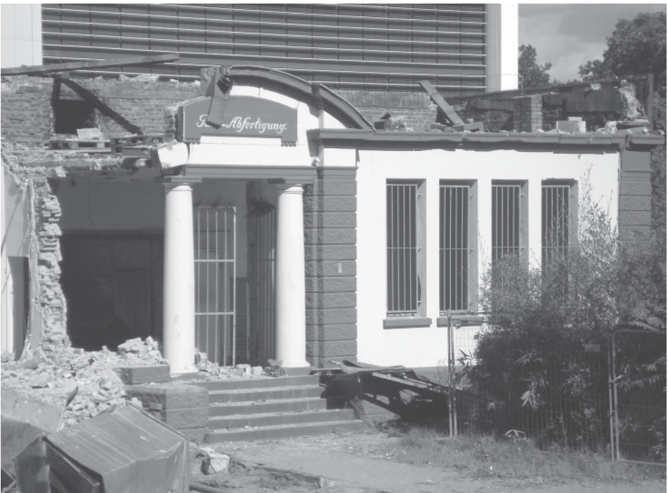
Das schöne Eingangsportal zur Hälfte abgerissen

Vielleicht werden die Macher von Les Halles einen anderen Standort finden und neu beginnen, es wird jedoch nie mehr dieselbe Atmosphäre sein. Für die geschichtsbewussten Bürger ist der Wegfall der alten Fassade mit dem Eingangsportal aber viel schmerzhafter. Schön wäre es gewesen, wenn Teile davon gerettet worden wären. Als Erinnerung an den Güterbahnhof hätten sie an anderer Stelle aufgestellt oder in das neue Gebäude integriert werden können. Die Fassade mit dem Tor war gut erhalten. Nun ist das ehemalige Abfertigungsgebäude ein Haufen Schutt und der Platz wird für den Neubau hergerichtet. Natürlich ist allen bewusst, dass das Gebäude keinen Bestandsschutz hatte. Das Ergebnis des Werkstattverfahrens ist be-