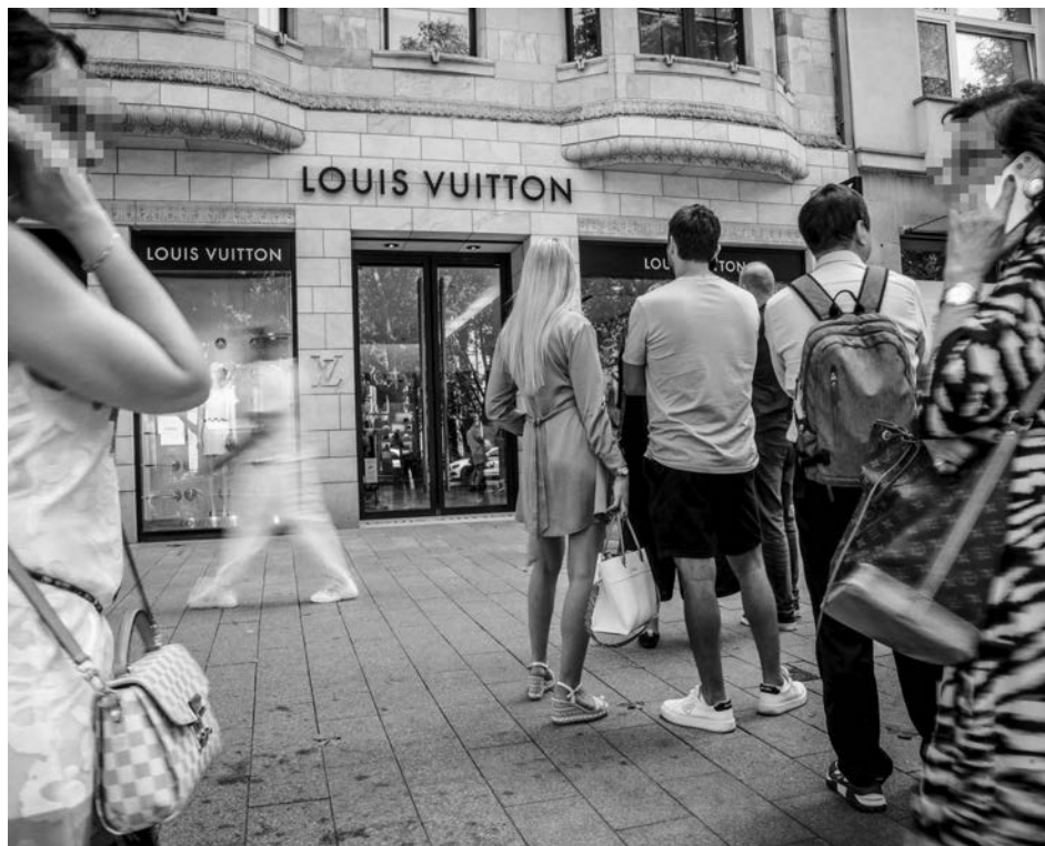
Lange Warteschlangen vor den exklusiven Geschäften auf der Königsallee sind in Düsseldorf schon lange keine Seltenheit mehr.

Angeblich, so wird mir erzählt, gibt es sie in einer nur begrenzten Auflage – was sie automatisch noch begehrter macht. Allerdings nicht ganz so exklusiv wie der Gral. Den gibt es nur ein einziges Mal. Dafür wurde er bis heute nicht gefunden.