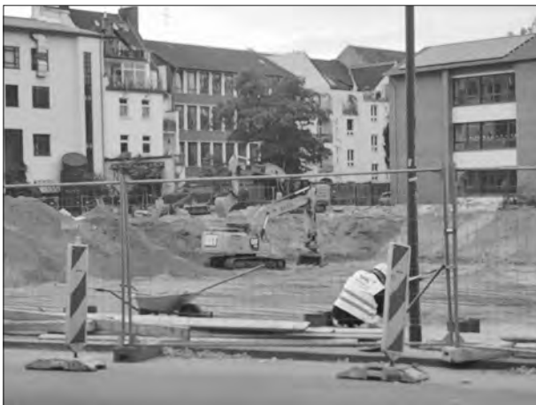
Auf der Baustelle wurde die Fliegerbombe gefunden.

Vieles lief überraschend glatt, eigentlich lag die Feuerwehr und das Team des Kampfmit-